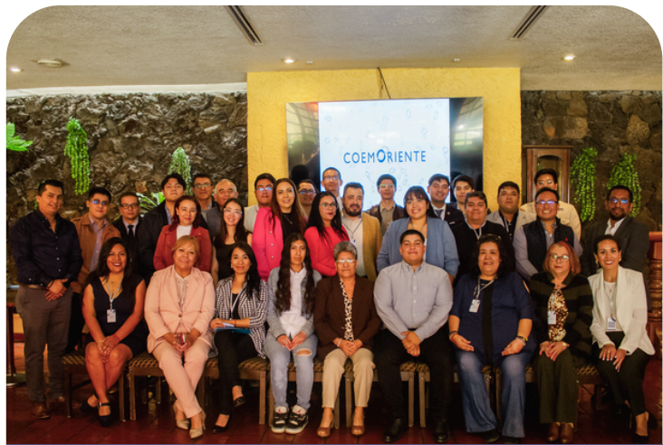
Consejo Empresarial Metropolitano Oriente

COEM Oriente nace de empresarios que conocen de cerca los retos de emprender y crecer en el oriente del Estado de México. Creamos espacios donde empresarios pueden conectar, generar alianzas y compartir experiencias reales que impulsen nuevas oportunidades de negocio dentro de una comunidad más cercana, dinámica y colaborativa.